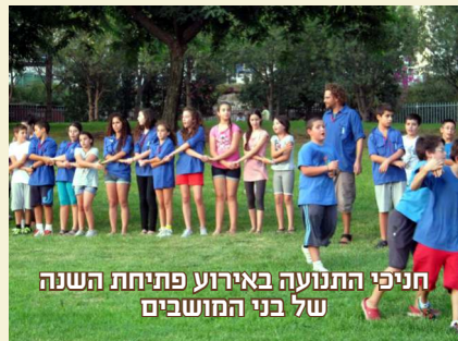
חניכי התנועה באירוע פתיחת השנה של בני המושבים